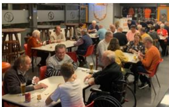
Koppelklaverjassen met finale avond