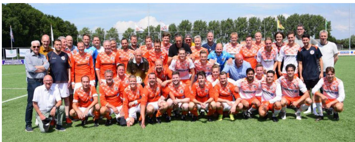
Kagia familie dag met Kagia 1 tegen Oud Kagia en jubileumloterij