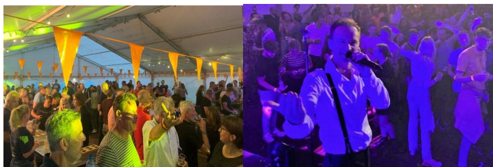
Feestavond met Run4Cover