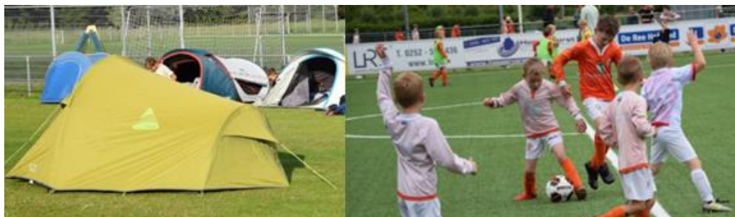
Tentennacht, speurtocht, vijfkamp en voetbaltoernooi jeugd