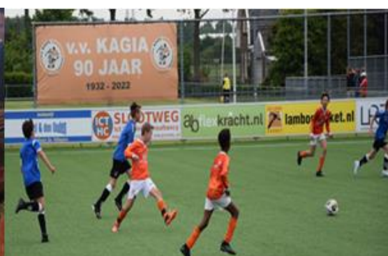
Thuisstoernooi voor alle jeugdteams